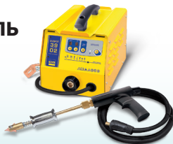
SPEEDLINER 39.02 - Арт. 035010 SPEEDLINER 39.04 - Арт. 035027