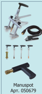
Manuspot Арт. 050679