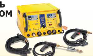
SPEEDLINER Combi 230 E PRO - Арт. 035072