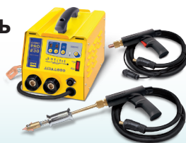
SPEEDLINER PRO 230 - Арт. 035034 SPEEDLINER PRO 400 - Арт. 035041