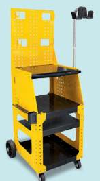
Тележка Spot 1600 Арт. 051348