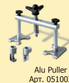
Alu Puller Арт. 051003